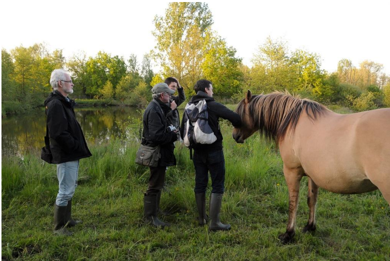
Werving van een nieuw lid?